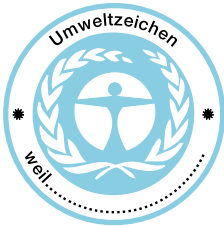
Àngel Blau (Blaue Engel) Alemanya

Etiquetes similars al Distintiu de garantia de qualitat ambiental presents en el mercat europeu, atorgades per l'Administració.