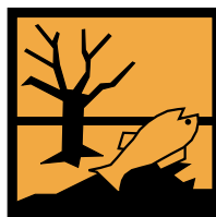
Perillós per al medi ambient