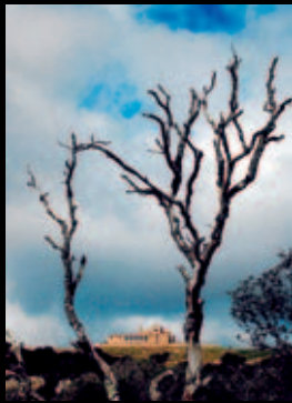
3r premi Títol: La Mola - Parc Natural Autor: Montserrat Guillamón Pradas