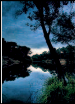
1r premi Títol: Mirall Autor: Francisco Rodríguez García