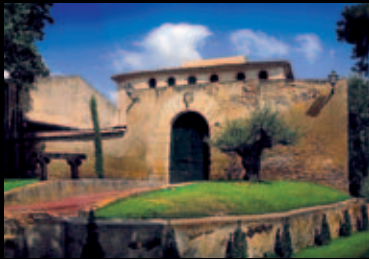
2n premi Títol: El Castell de Santiga Autor: Josep Ponsa Vilatersana